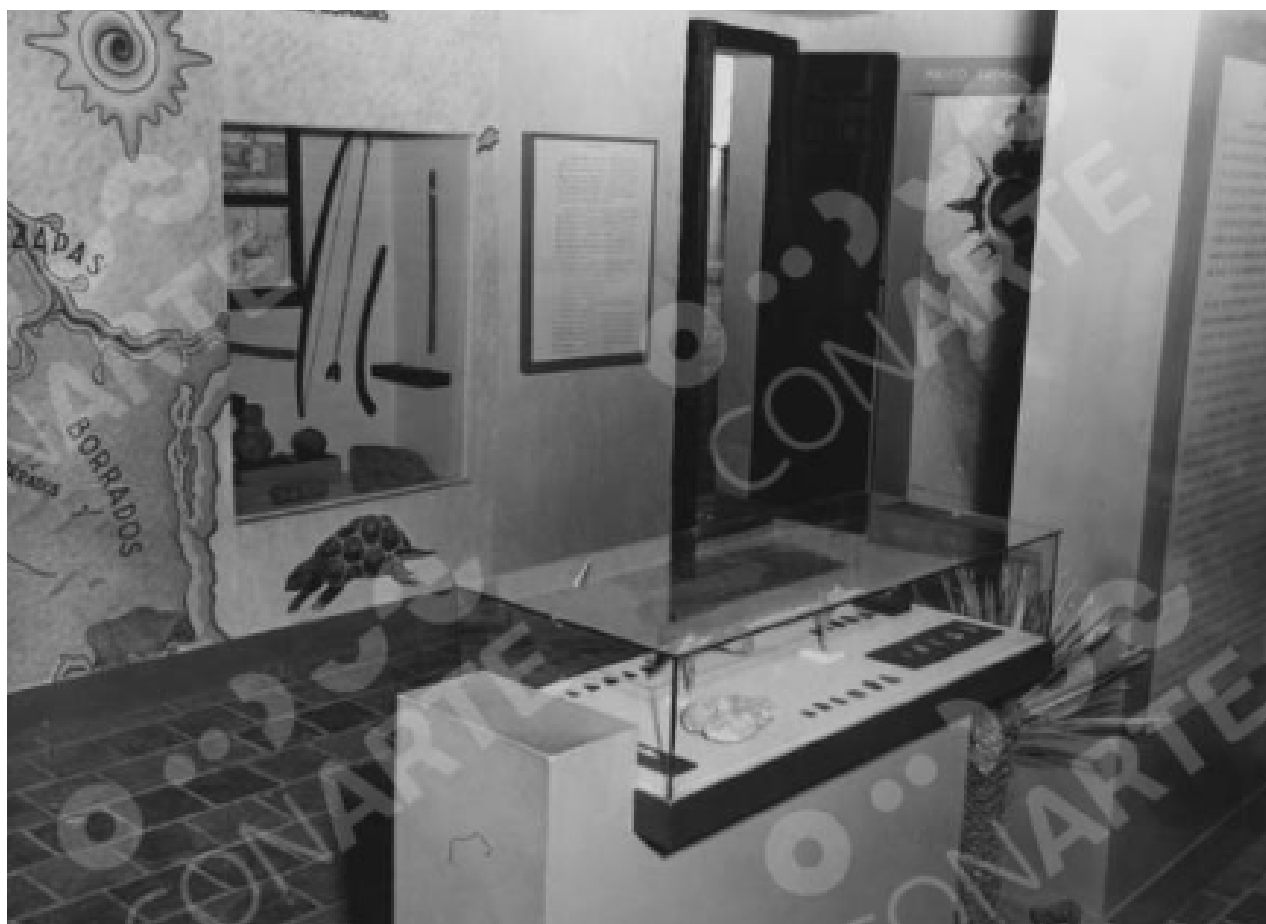
Imagen 4. Puntas de flecha y otros objetos de caza exhibidos en el Museo Regional del Obispado, 1987, Monterrey, Nuevo León, México