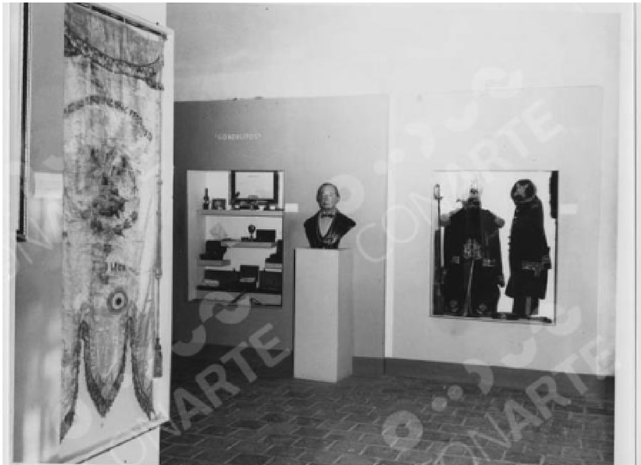
Imagen 2. Sala exposición en el Museo Regional del Obispado, 1987, Monterrey, Nuevo León, México: Fototeca Nuevo León.

negocios, impulsaron la innovación y actuaron en conjunto, también tuvieron sentido de propósito tras la desolación que vivió el país con la Revolución, criticaron al capitalismo salvaje, se dedicaron al estudio, crearon instituciones y tuvieron visión social. Algunos personajes representativos fueron Rosario Garza Sada, Antonio L. Rodríguez, Bernardo Elosua, entre otros, y empresas representativas fueron Hojalata y Lámina, Berel, Industria Alkali y Fundidora de Fierro y Acero de Monterrey (Salinas, 2020).