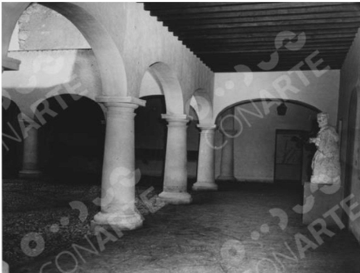
Imagen 3. Pasillo y escultura de Santo Domingo de Guzmán en el patio del Obispado, 1987, Monterrey, Nuevo León, México