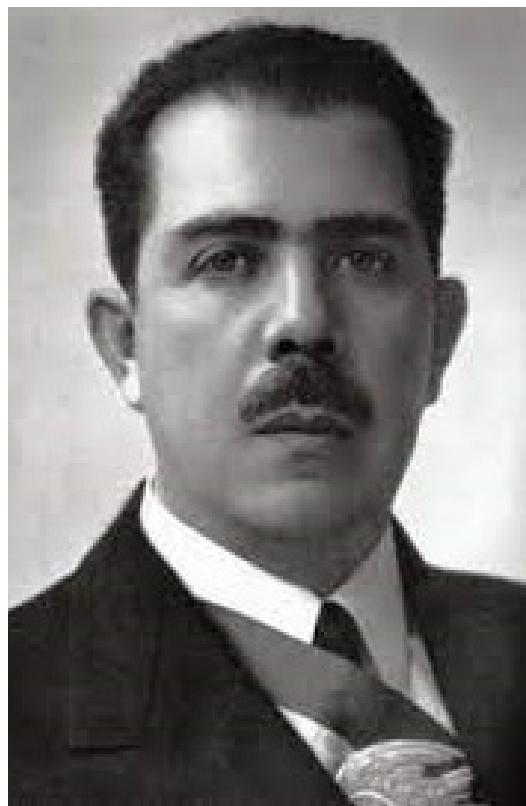
Lázaro Cárdenas del Río.

En el último año de administración del General Lázaro Cárdenas se llevó a cabo el VI Censo General de Población, el 6 de marzo de 1940 (ver gráfico al final de este artículo).