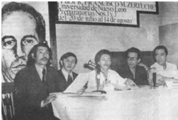
Escenas del Ciclo Cultural de Verano "Profr. Francisco M. Zertuche".