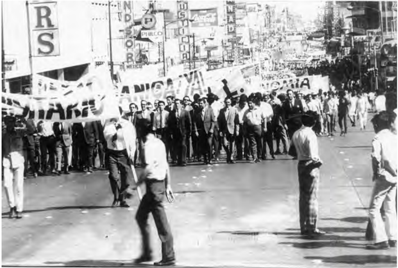
Manifestación universitaria del 25 de marzo de 1971, por calles del centro de la ciudad.