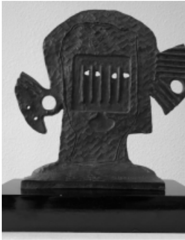
Autorretrato con retrato

parte del Tomo 2 del libro Una Historia con Futuro 85 años de la UANL . Ávila redactó el capítulo 7 que tituló: 'De la expansión a la diversificación, 1973-1985' y que subtituló en forma sugestiva: 'de los kellogs boys a la Bata blanca'".