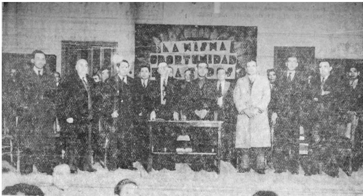
Fotografía del día de inauguración de la Escuela Nocturna de Bachilleres.