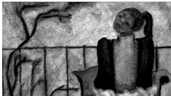
Número 86 (abril-junio de 2016) Año 24. Portada: “El cordero de Dios” de Federico Cantú.