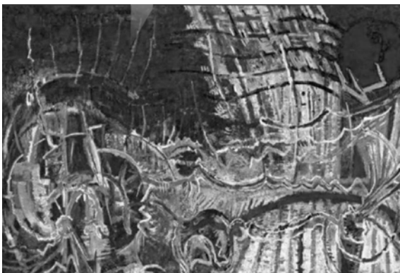
Número 84 (Septiembre-diciembre de 2015) Año 24 Portada: Chapulín azul , de Francisco Toledo. Técnica: acuarela y tinta sobre papel. Medidas 10 1/8 X 13.7/8 pulgadas.