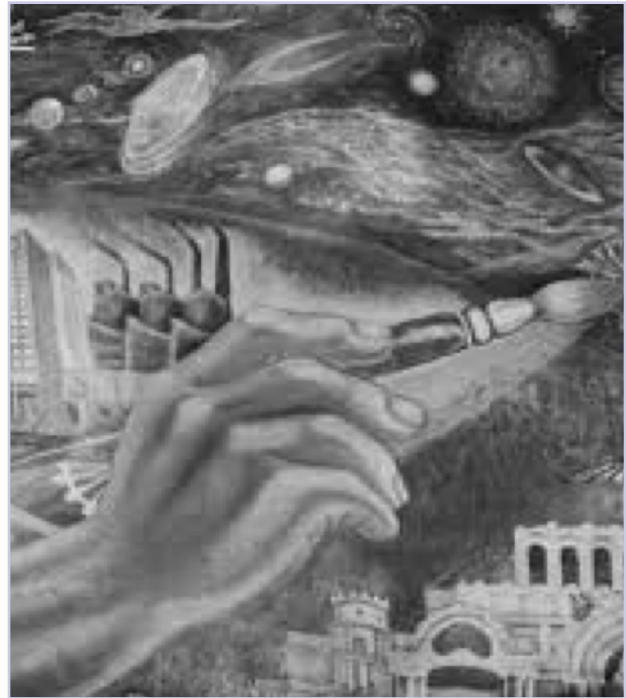
Detalle Trayectoria de la cultura en México

"La poesía es expresión del espíritu humano y se manifiesta únicamente por las palabras que la conforman. La creación poética se cumple en un proceso individual, mediante la conversión en palabras del cúmulo de vivencias, emociones, imágenes, recuerdos, sentimientos y todo lo que se agita en el interior del poeta. Escribir poesía es una tarea solitaria, en la que el creador enfrenta en soledad la lucha con la palabra, y todo el conjunto de elementos antes mencionados lo mueve a construir el poema, a partir del momento emergente en que surge el lenguaje. En ese momento, que puede ser impulsivo, o reflexivo, la conducción hacia la palabra se somete a la singular tarea de transmutar la plétora donde se conjunta la diversa y plural integración del haber mental, y la tarea poética va a consistir en transformar ese contenido interior en palabras. Así la tarea poética es esencialmente individual, es decir, por necesidad es una acción solitaria" (pág. 1).