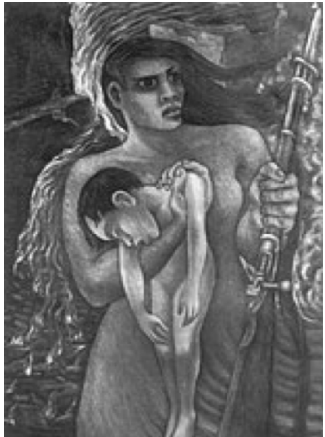
Mujer de la guerra

Catedrático de la Facultad de Filosofía y Letras de la Universidad Autónoma de Nuevo León, de la Escuela Normal Superior de la Ciudad de México y del Doctorado en Filosofía y Letras de la Universidad Nacional Autónoma de México.