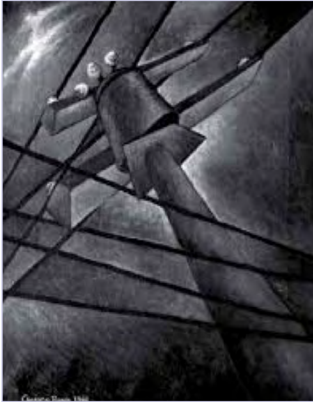
Estudio en azul