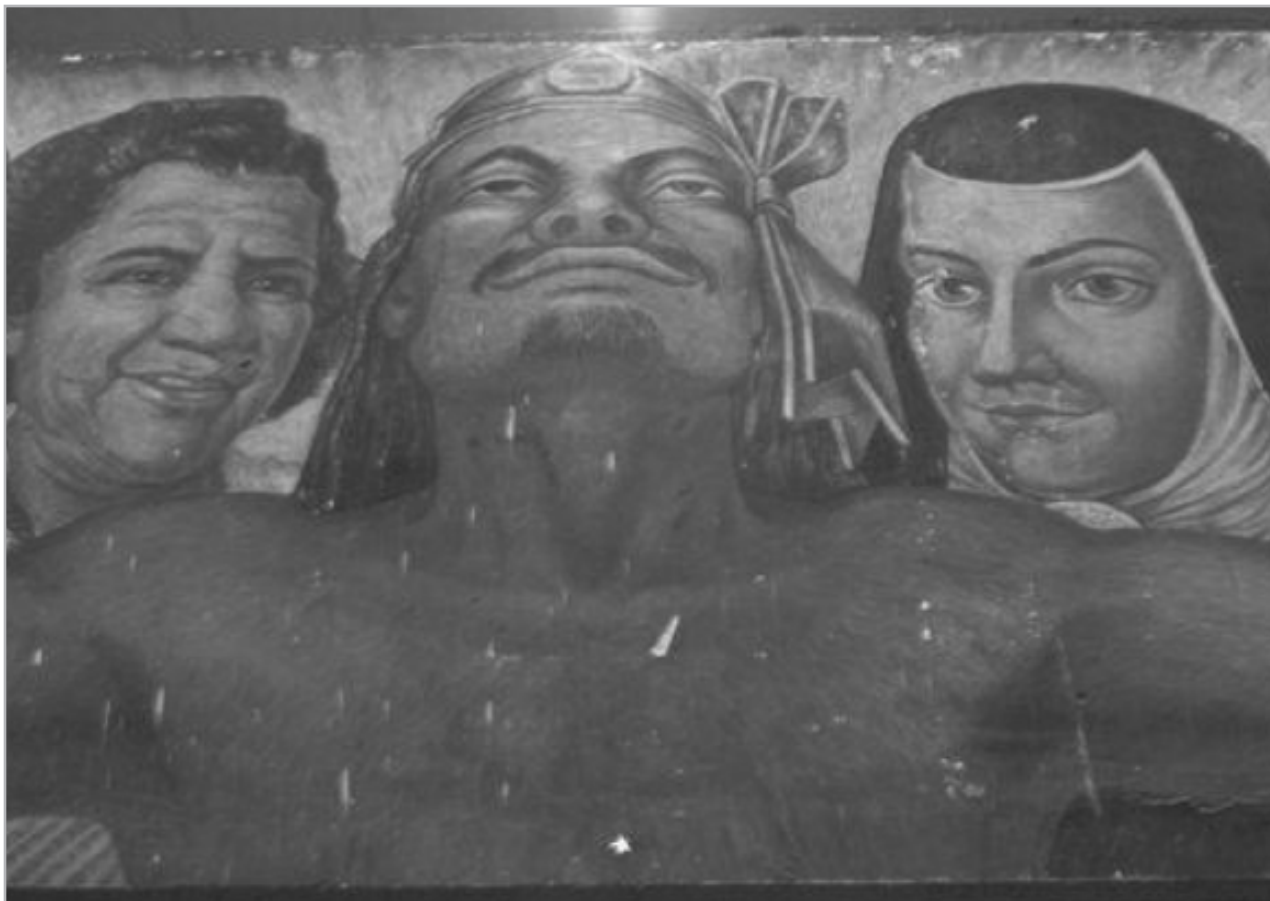
Constructores de la cultura nacional