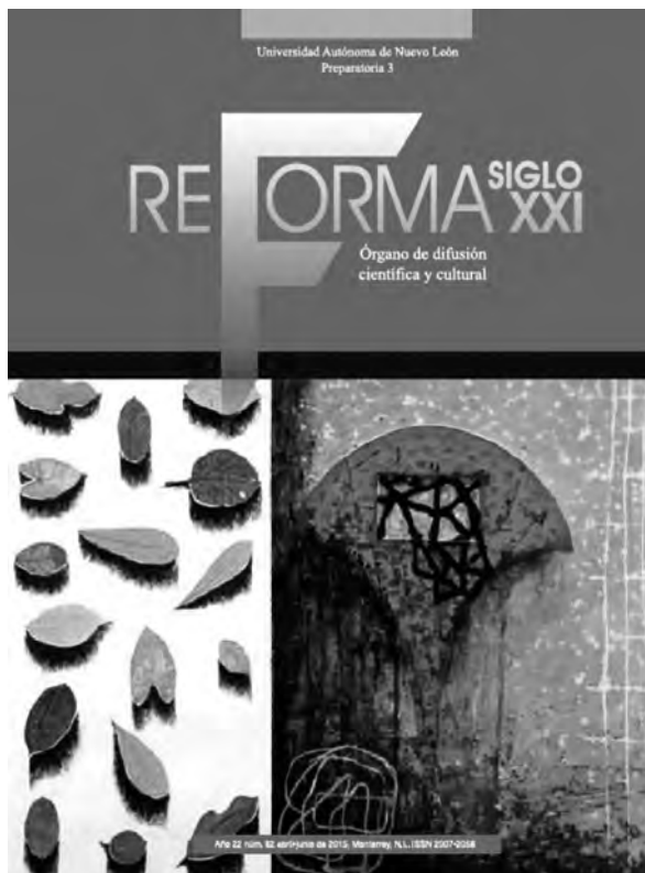
Revista Reforma Núm. 82