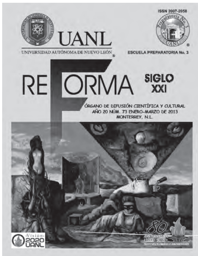
Revista Reforma Núm. 73

Además de esta celebración tan importante, tenemos otras dos razones para sentirnos motivados a continuar por el camino de la superación, y consisten en que la Escuela Preparatoria Núm. 3 de nuestra Máxima Casa de Estudios está celebrando el 8 de Diciembre de este año 2019, el 82 aniversario de su fundación, y