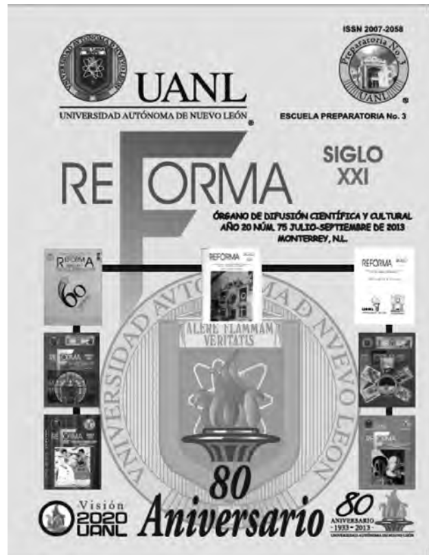
Revista Reforma Núm. 75

Sabemos que la tarea educativa es constante y permanente, por esa razón, aún cuando las