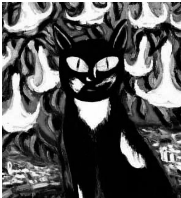
Gato en un jardín florido

También en el 2003, se presenta Brigada Delfín Ocho con nuevas estrategias, ahora en el Desarrollo Personal, el entrenamiento científico con las Olimpiadas en diversas áreas y el Taller de Expresión Oral fomentando el hábito de la