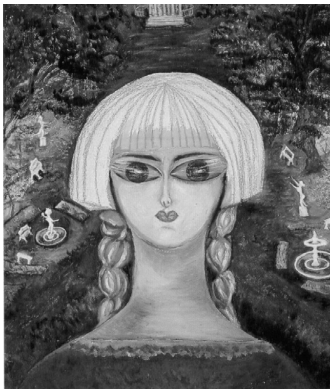
Autorretrato en los jardines de Versalles

Buena pregunta. A mí me nace el interés por la Historia con el maestro de primaria de El Peñuelo, quien le