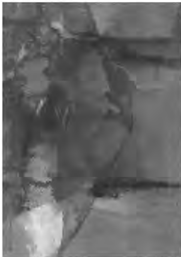
Montaña en el crepusculo

Con este tipo de acontecimientos se está cumpliendo con uno de los objetivos de esta Institución: Difundir, valorar y promover los conocimientos históricos, locales, nacionales e internacionales. Enhorabuena por la Sociedad de Historia y que continúen sus logros.