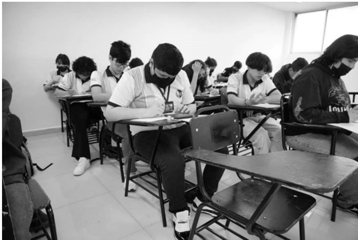
Las habilidades escrita y lectora son esenciales en todos los aspectos de la vida.

grupos, cada uno de entre 27 y 35 estudiantes, dando un total de 857 estudiantes que participaron en la estrategia.