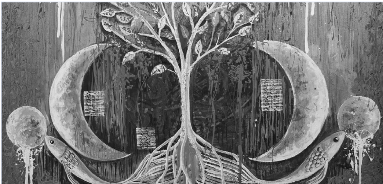
Lunas de mayo

2) Archivo de la Ciudad de Monterrey (1799) Causas Criminales , Vol. 33, Exp. 581, folios 276 a 316