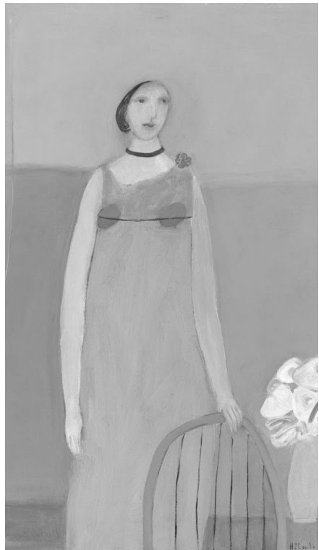
Chica de pie con vestido verde