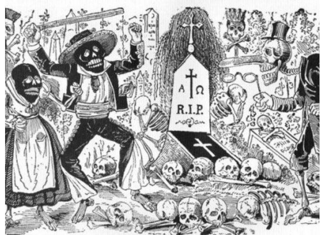
Grabado de José Posada

En los versos del 7 al 9 sostiene que él crecerá continuamente en la alabanza de la posteridad; asegura que esto sucederá mientras el pontífice suba al Capitolio con la silenciosa virgen. Pues se quedó muy corto, porque el Imperio Romano desaparece hacia el siglo V de nuestra era y con él desaparecen el Sumo Sacerdote romano y las vestales. No se sabe a qué ceremonia se refirió exactamente el poeta; podía ser la ceremonia particular en que una vestal subía al Capitolio a la derecha del pontífice; también podía ser la solemne ceremonia anual en que la Virgen Máxima subía al templo de Júpiter Capitolino a hacer votos por el bien del pueblo. Este acto religioso se verificaba exactamente en los idus de marzo. Por último, es posible también una referencia a las procesiones generales, en las que no