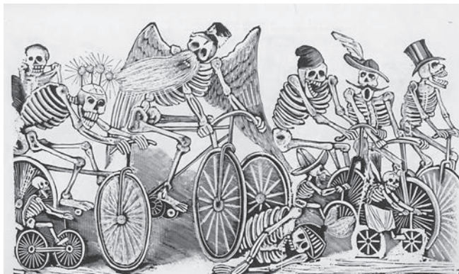
Calaveras en bicicleta

Me Colchus et, qui dissimulate me tum Marsae cohortis, Dacus et ultimi Noscent Geloni; me peritus Discet Hiber Rhodanique potior.