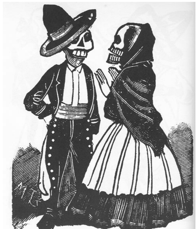
Calaveras de José Guadalupe Posada

“Carpe diem” y “Non omnis moriar” son sus frases más célebres y más conocidas. La primera la encontramos en la brevísima oda XI del Libro Primero, dedicada a su amiga Leucónoe; la segunda en la oda XXX del Libro Tercero, la cual aquí hemos comentado. Muchas otras frases de profundo sentido pueden extraerse de sus obras, todas en verso. Con mucho gusto lo haré en otros artículos que espero poder escribir.