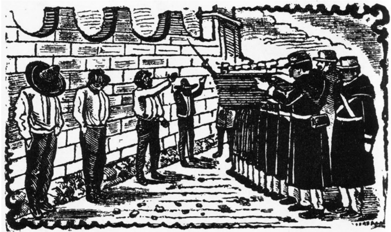
Corrido de los cuatro zapatistas fusilados

Y hace una bola con el papel, va hasta la mochila, la abre, mete el papel hecho bola y cierra la mochila. Después, el niño que se siente grande, sale a jugar con su gatito.