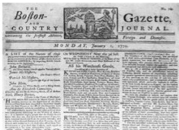
Figura 2. The Boston Gazette, 20 de marzo de 1728.

Hasta el año de 1728, no parece considerarse la posibilidad de comunicación bidireccional. Fue hasta un siglo más tarde, en 1833, cuando se encuentra una reseña en la que podemos reconocer una comunicación de doble vía. Este dato se encuentra en el número 30 del periódico sueco Lunds Weckoblad , en el que se insertó el siguiente anuncio (Baat, 1985): "El abajo firmante, con todo respeto, avisa a aquellas damas y aquellos caballeros de las ciudades vecinas que estudian composición a